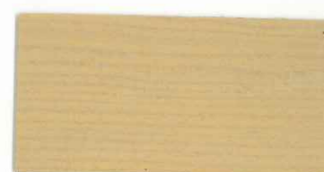
030 オパールホワイト