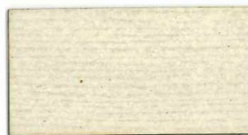
030 オパールホワイト