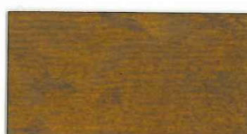
236 スモーキーライト

●標準2~3回塗りです。(見本3回塗り) ●クリアー色は着色に比べ耐候性は低下します。 ●油性ですが水分を含むので凍結に注意。