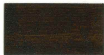
102 チャコールブラウン