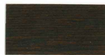
102 チャコールブラウン