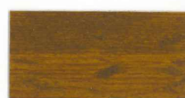
236 スモーキーライト

●標準2~3回塗りです。(見本3回塗り) ●クリアー色は着色に比べ耐候性は低下します。 ●油性ですが水分を含むので凍結に注意。